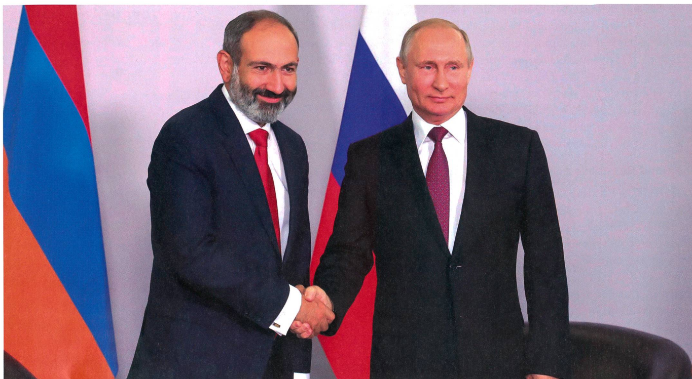
Der armenische Premierminister Nikol Paschinjan und Vladimir Putin.