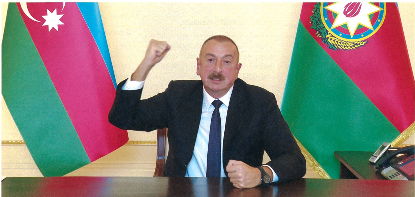
Ilham Aliyev Präsident von Aserbaidschan in einer Ansprache an sein Volk am 4.10.2020.

Das Feuer des Bergkarabach-Konflikts zwischen Armenien und Aserbaidschan schwelt seit dem Ende des Krieges 1994 und wurde Ende September 2020 neu entzündet. Die militärische Potenz Aserbaidschans, verbunden durch die massive Unterstützung durch die Türkei, macht eine friedliche Zukunft mittelfristig unrealistisch. Dieser Konflikt wird prognostisch noch viele Jahre andauern und zahlreiche weitere Menschenleben kosten, von Soldaten und von Zivilisten. +