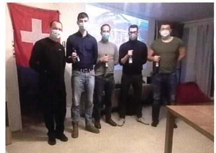
Screenshot einiger Kameraden aus dem Home Office.