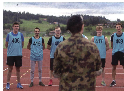
Sport in der Armee