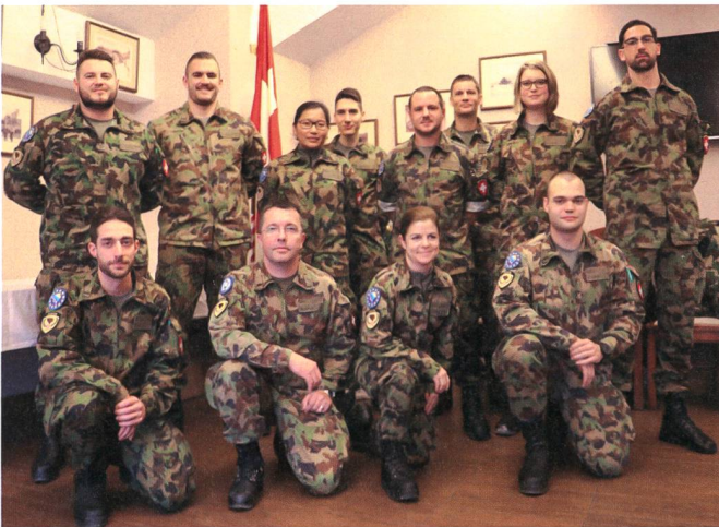
Angehörige der EUFOR Mission.