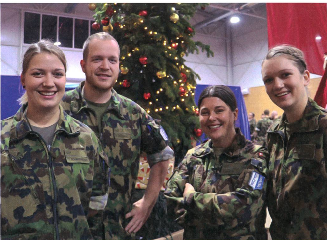
San Uofs der Swisscoy.