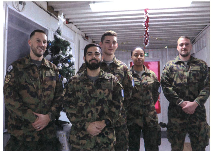
Auch über die Festtage im Einsatz: LMT- Team Nr 4.