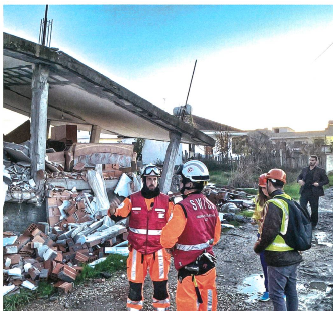
Schweizer Profis im Einsatz.

Die Situation, welche die Durchdiener heute erleben werden ist komplett eine andere als die Berufsmilitärs zeitgleich in Albanien spüren, beide Male aber musste des FGG 3/9 den Einsatz koordinieren und unterstützen. +