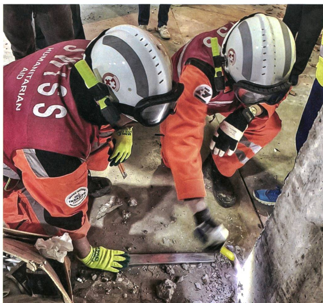
Bleibt das Gebäude stabil?