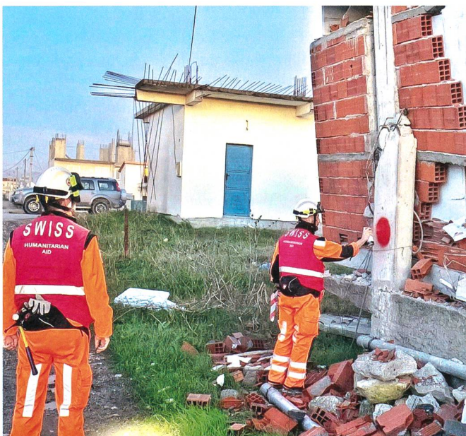
Gebäude werden markiert.

09:30 in der Effingerstrasse 27 in Bern. Die Einsatzleitung der HH bespricht die verschiedenen Instrumente der Hilfe für Albanien und wiegt Vor- und Nachteile gegeneinander ab. Die Verfügbarkeit der Berufsmilitärs aus dem Lehrverband wird