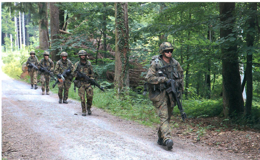
Auf der Verschiebung bei der Übung «DURO».

An der BUSA angekommen, traf mich dann gleich der Schlag. Ich war es bereits gewohnt, mit Abkürzungen und Zahlen zu arbeiten. Jedoch habe ich gemerkt, dass das Militär viel zu viel davon benutzt. Allein die Reglemente und einfachsten Dinge hatten andere Namen, wie z.B. der Rucksack (Packung). Nach einer kurzen Eingewöhnung war aber auch das nur noch selten ein Problem. Viel mehr hatte ich Mühe mit den Theorieeinheiten, die in der Anfangszeit eine hohe Frequenz hatten, zurechtzukommen. Die Schulbank