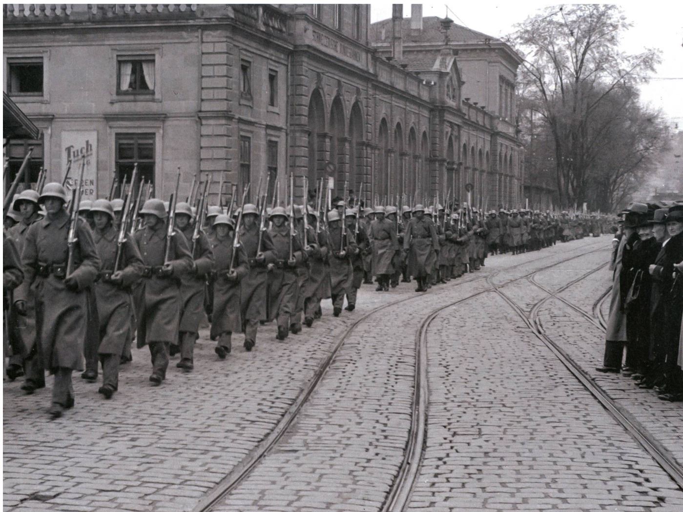
Nach dem Defilee zum Aktivdienst: Infanteristen 1939.

Italien trat am 10. Juni in den Krieg ein und es drohte nicht nur eine Einkreisung, sondern auch eine Wirtschaftsblockade. Der Hafen von Genua war für die schweizerische Versorgung lebenswichtig. Da auch englische Einschränkungen gegen Neutrale ausgesprochen wurden, drohte die totale wirtschaftliche Isolation. Einzige