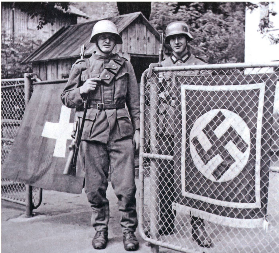
Ab 1940 von den Achsenmächten umzingelt.

Fortsetzung folgt in der nächsten Ausgabe