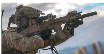
Das Sturmgewehr HOWA 5.56.

Ende 2019 gab das japanische Verteidigungsministerium die Einführung eines neuen Sturmgewehrs sowie einer neuen Dienstpistole für die japanischen Selbstverteidigungskräfte bekannt. Das HOWA 5.56 wird das gegenwärtig in Nutzung befindliche Howa Typ 89 Sturmgewehr ablösen. Im Vorfeld hat das Verteidigungsministerium eine Vorauswahl getroffen und Testmuster der drei in Frage kommenden