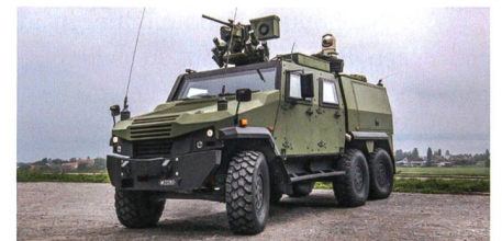
EAGLE 6x6: Neues Aufklärungsfahrzeug.

Die Schweizer Armee beauftragt General Dynamics European Land Systems-Mowag mit der Lieferung von 100 EAGLE 6x6 Aufklärungsfahrzeugen. Dieser erste Serienauftrag ist einen Meilenstein für die aktuellste Weiterentwicklung der EAGLE-Fahrzeugfamilie. Die 100 EAGLE V 6x6 Fahrzeuge werden als Trägerplattform im taktischen Aufklärungssystem «TASYS» eingesetzt. Das System TASYS dient der Nachrichtenbeschaffung der