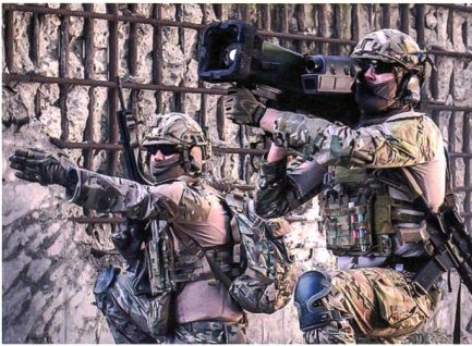
MBDA ENFORCER im Einsatz.

In seiner letzten Sitzung 2019 hat der Haushaltsausschuss des Deutschen Bundestages die Lieferung von 850 Lenkflugkörpern «Leichtes Wirkmittel 1800+» im Wert von ca. 76 Millionen Euro genehmigt. Dem Vernehmen nach wurde der ENFORCER von MBDA von der Bundeswehr im Zuge eines Wettbewerbs als Leichtes Wirkmittel 1800+ ausgewählt. Da insbesondere Spezialkräfte Bedarf für einen weiteren Präzisionseffektor jenseits der Reichweite des Wirkmittel 90 hinaus sehen, wurde seitens der Bundeswehr die Initiative «Leichtes Wirkmittel 1800+»