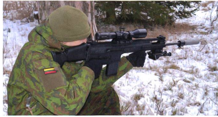
FN SCAR-H PR mit Schalldämpfer.

Die französischen Streitkräfte beschaffen offenbar das FN SCAR-H PR im Kaliber 7,62 mm x 51 als halbautomatisches Scharfschützengewehr «Fusil de précision