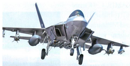
MBDA Meteor für den KF-X.

MBDA hat von Korea Aerospace Industries einen Auftrag für die Integration der Meteor Luft-Luft-Lenkwanne in das zukünftige Kampfflugzeug KF-X erhalten. Der Vertrag beinhaltet die Integrationsunterstützung für KAI, Know-how-Transfer und die Herstellung von Testgeräten für die Integrations- und Testkampagne des KF-X. «Südkorea ist ein strategischer Markt für MBDA, und wir sind stolz dar-