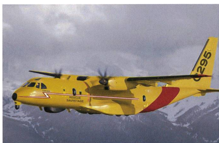
CC-295 für die kanadischen Such- und Rettungskräfte.

Die Royal Canadian Air Force hat in Sevilla ihre erste Airbus C295 in Empfang genommen. Bis 2022 sollen 16 Maschinen ausgeliefert sein, die die Bezeichnung CC-295 erhalten. Ab dann läuft auch der Wartungs- und Supportvertrags für das Flugzeug mit Airbus, der mit Optionen bis 2042 laufen kann. Das neue Such- und Rettungsflugzeug übernimmt die Aufgaben von sechs CC-115 Buffalo und zwölf