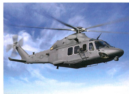
Boeing MH-139A Grey Wolf.