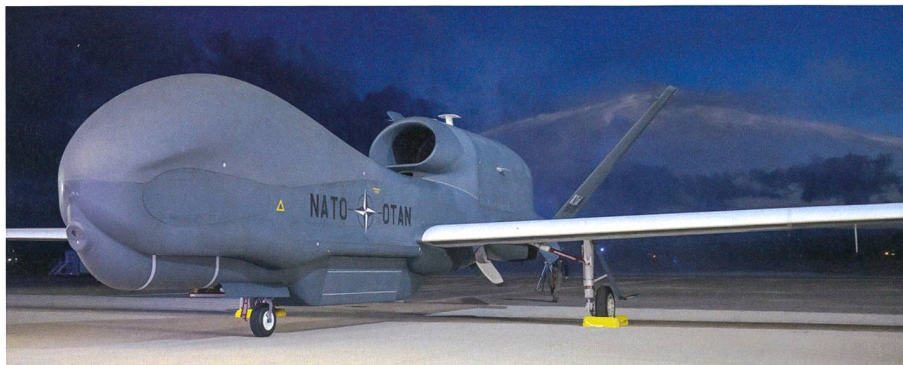
NATO-Drohne RQ-4D in Italien angekommen.

Das zweite unbemannte Gefechtsfeldüberwachungsflugzeug RQ-4D des NATO-Bündnisses ist in Europa eingetroffen. Diese jüngste Atlantiküberquerung von Kalifornien nach Italien wurde vollständig von einem Piloten auf der AGS-Hauptbasis in Sigonella kontrolliert. Die Northrop Grumman RQ-4D, auch bekannt als «Phoenix», startete am Mittwoch, 18. Dezember 2019 um 8:40 Uhr Ortszeit von der Edwards Air Force Base in Kalifornien, USA und landete etwa 20 Stunden später auf der AGS Main Operating Base auf Sizilien.