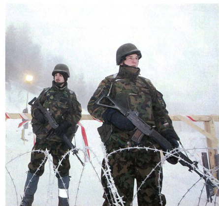
Die Armee schützt