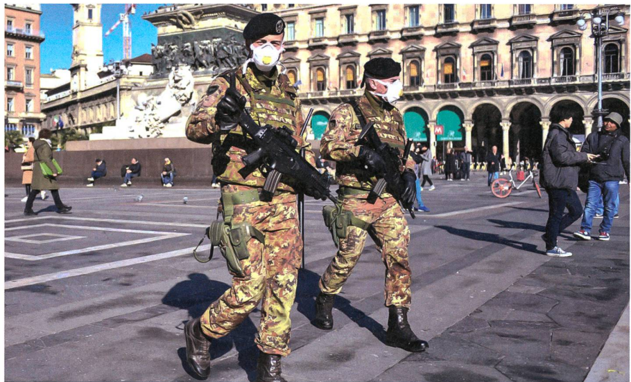
In Norditalien teil des Strassenbildes: Italienische Armee.

In Norditalien gehört das Militär mittlerweile zum Strassenbild. Die Angst vor dem Virus hat die Region im Griff. Mailand, das Wirtschaftszentrum der Nation scheint im Winterschlaf zu liegen. Armee und paramilitärische Kräfte (Carabinieri) haben bislang 52 000 Einwohner in 11 Städten und Gemeinden isoliert. Ohne Sondergenehmigung kommt niemand raus. Das öffentliche Leben ist komplett zusammengebrochen und alle Schulen wurden per Notdekret geschlossen. Mailand ist jedoch bis heute (Stand 01.03)