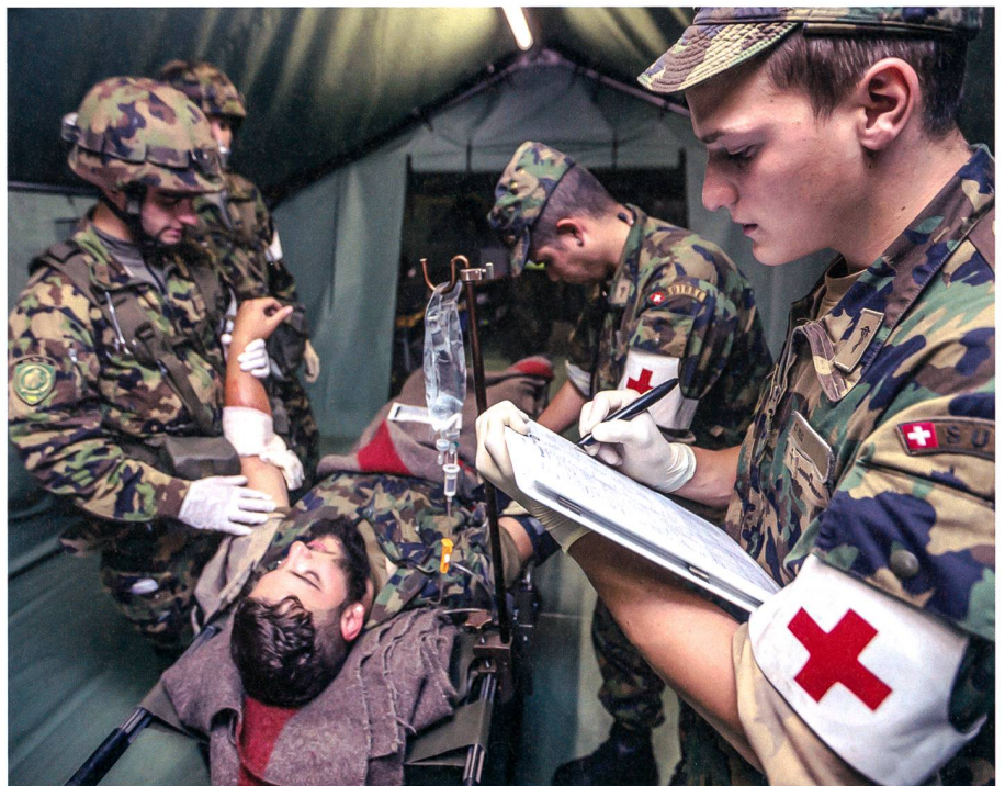
Stehen derzeit im Fokus: Angehörige der Sanitätstruppen.

Die Spitalbataillone (Spit Bat) der Schweizer Armee könnten die zivilen Spitäler entlasten. Eine ihrer Hauptaufgaben ist das Betreiben eines vollgeschützten Militärspitals für bis zu 200 Patienten. Vorteilhaft ist, dass der Spitalaufenthalt der meisten Patienten eher kurz nötig ist. Derzeit sind je-