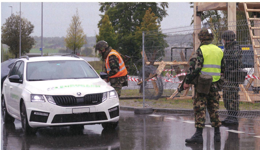
Zivile Behörden können eine Entlastung in aussergewöhnlichen Umständen immer brauchen.