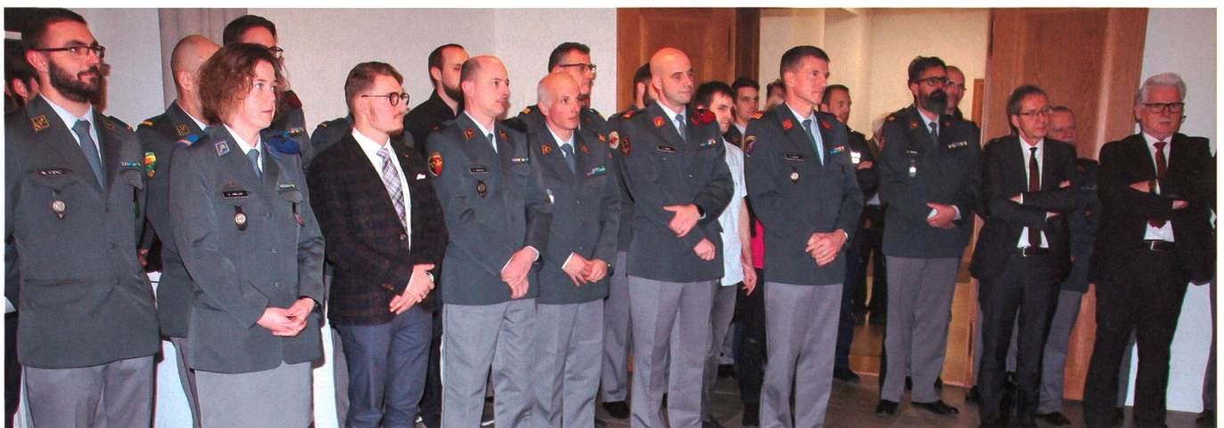
Besuch im Foyer der Gedenkausstellung René Villiger.

Hunderte von Tagen aber, an denen alle mit Pflichtbewusstsein, Loyalität und Souveränität dem Land gedient hätten. «Das ist besonders wichtig oder sogar unentbehrlich für eine funktionierende Armee». Er streifte auch geschichtliches aus der Schweizer Armee sowie die Veränderungen in der ganzen Welt. Die Bedrohungslage und die Herausforderungen der Gegenwart hätten sich sehr verändert. Aufgabe, auch der obersten Kader der Armee sei es, gegenüber der Bevölkerung die Sicherheitslage und die konkrete Bedrohung offen zu kommunizieren, ohne zu dramatisieren, aber auch ohne zu bagatelisieren. Die Armee müsse in der Schweiz von breiten Schichten der Bevölkerung getragen werden und die Notwendigkeit der Landesverteidigung mit überzeugenden Argumenten aufgezeigt werden. «Wir entlassen sie heute aus den Pflichten als Offiziere oder höhere Unteroffiziere», aber es heisse: «Einmal Offizier – immer Offizier» und auch «Einmal Unteroffizier – immer Unteroffizier». Auch in der Gesellschaft, in der Politik, in Fachgremien und Vereinen sei das Engagement dringend notwen-