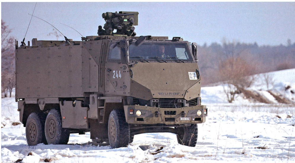
Geschütztes Mannschaftstransportfahrzeug GMTF mit starker Panzerung für Evakuationen von gefährdeten Personen und die verdeckte Annäherung. Dieses mit Sensoren und Wärmebildkamera ausgerüstete Vehikel wird von der Armee zu fairen Bedingungen an diverse Polizeikorps ausgeliehen.

den keine gestellt. Armee und Polizei profitierten von dieser unbürokratischen Zusammenarbeit. Innere und äussere Sicherheit kann man eben nicht klar voneinander trennen! Die Übergänge sind fließend und deshalb braucht es eine vertrauensvolle Zusammenarbeit. Leider lassen Vollkostenrechnungen und kompliziertere Strukturen in unseren Tagen den Amtsschimmel wiehern.