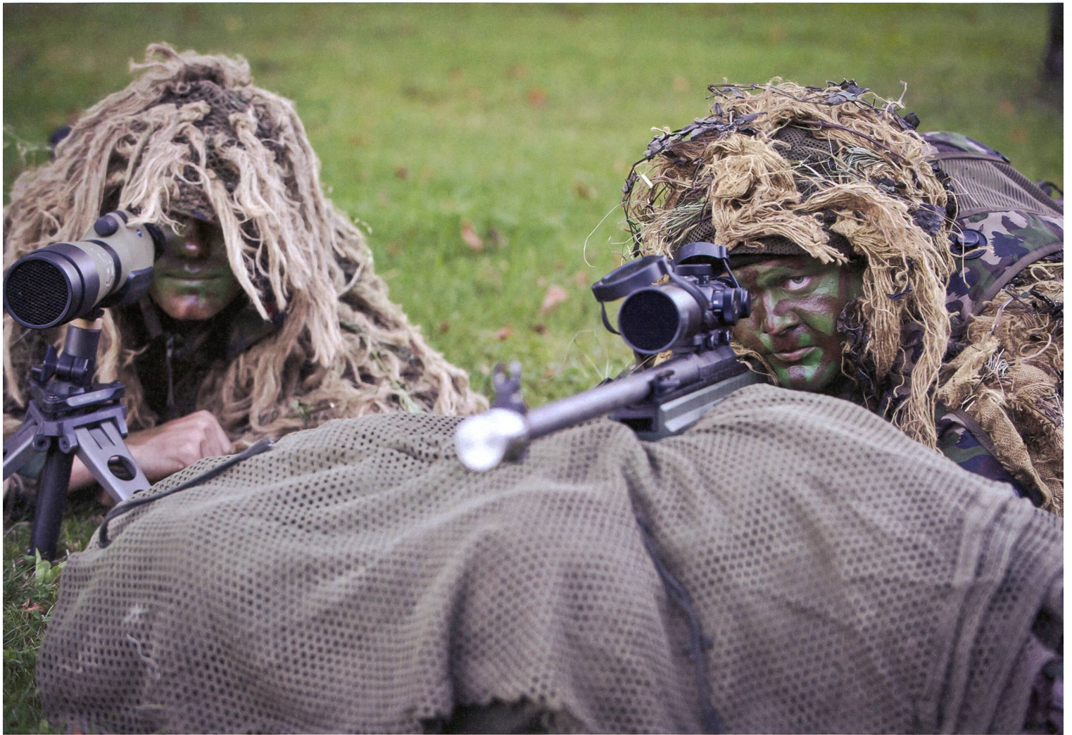
Scharfschützen der Armee und der Polizei verfügen praktisch über die gleiche Ausrüstung und Tarnung.

Landesregierung und deren nächste Angehörige im Krisenfall vor direkten Angriffen schützen. Die über 100 militärischen Personenschützer, Männer und Frauen, gehören bis heute allesamt zivilen Polizeikorps an. Sie müssen bei der Umteilung in die Armee Angehörige einer Sondereinheit sein. Jetzt heisst die Truppe Militärpolizei-Schutzdetachment.