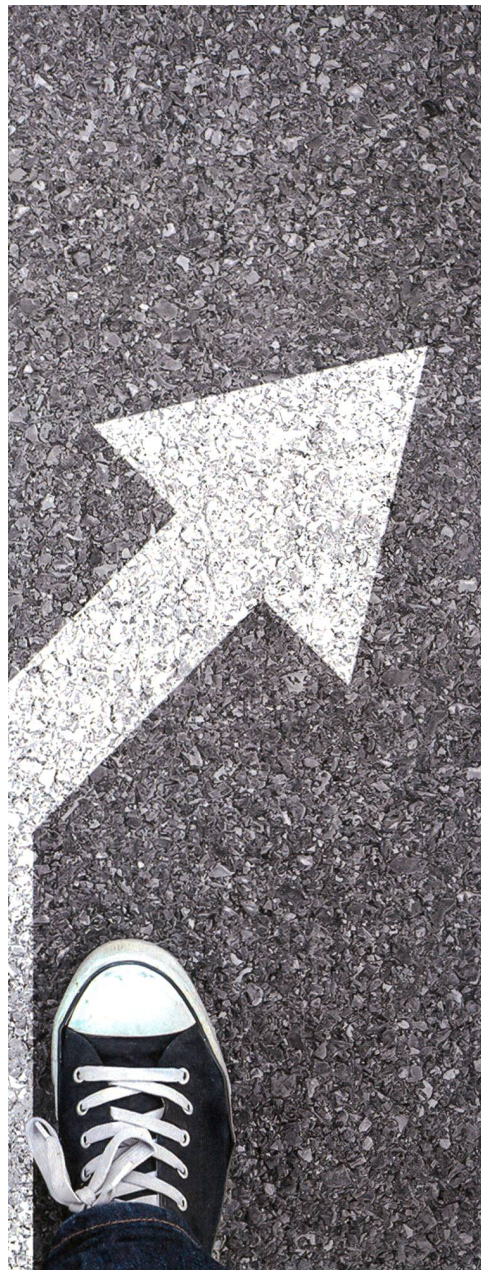
Lektion und Mut zum Erfolg.

diesem Studienabschluss zwar sicher einen gut bezahlten Arbeitsplatz, aber nicht einen für ihn erfüllenden Job finden würde. Wieso also weiterfahren?