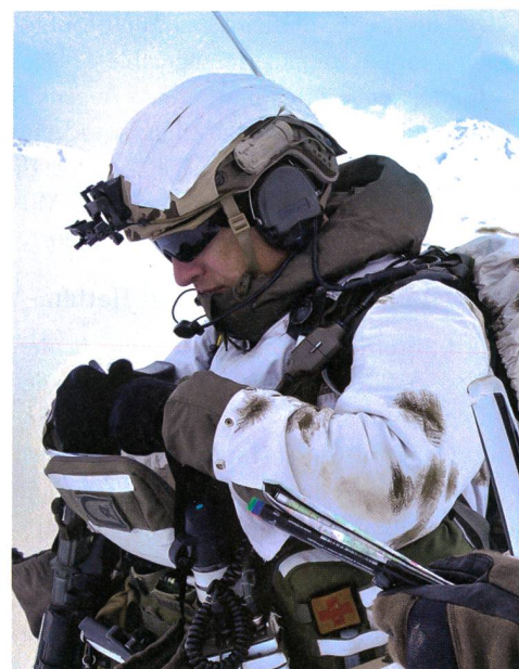
Sichere Kommunikation ist bei allen Einsätzen