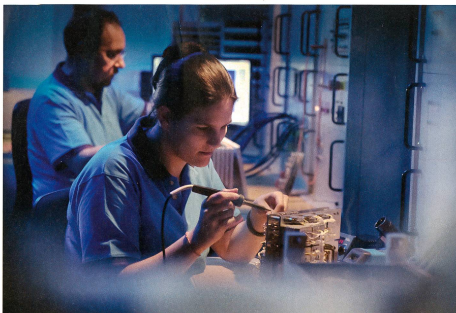
Fachspezialisten von RUAG prüfen aktuelle und neue Anforderungen an moderne Technologien.

Im Rahmen dieses Produktportfolios bietet RUAG aktuell auch eine bedürfnisorientierte Lösung für spezifische Projekte der Schweizer Armee. Die kosteneffiziente Lösung erfüllt die Forderung nach mehr Kommunikationskapazität bei erhöhter Mobilität. Als Technologiepartner der Schweizer Armee kennt RUAG die spezifischen Kundenanforderungen und die konkreten Einsatzszenarien. Das gebündelte Wissen als langjähriger Systeminteg-