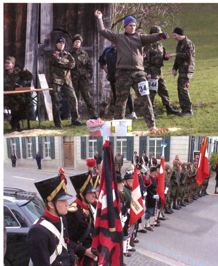
Die Vielfalt der Angebote der ausserdienstlichen Tätigkeit ist sehr gross und ebenso vielfältig.