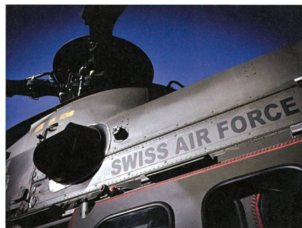
Luftwaffe: Schutz des Luftraums