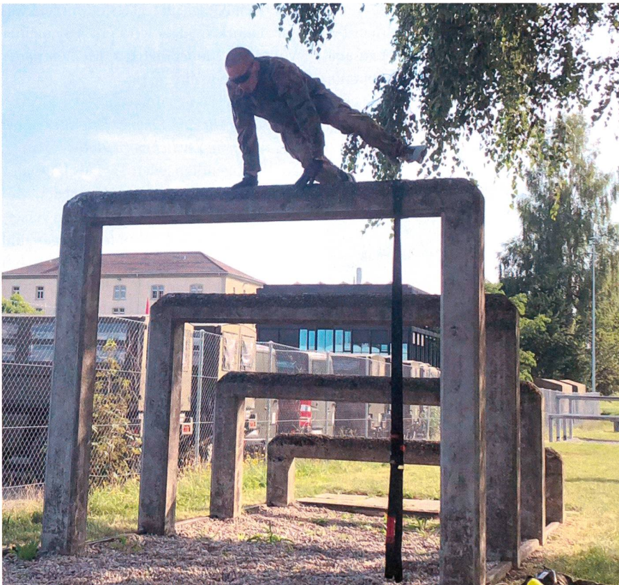
Währenddessen an der BUSA: MSL-Teilprüfung Hindernisbahn – der Bärentritt!

Am Montag, nach einer Nacht in der Mehrzweckhalle, wurden die Teilnehmer in zwei Gruppen eingeteilt. Die 13 Teilnehmer der Berufsunteroffizierschule (BUSA) bildeten die eine Gruppe, die erfahrenen Berufsoffiziere und Berufsunteroffiziere die andere. Während die BUSA-