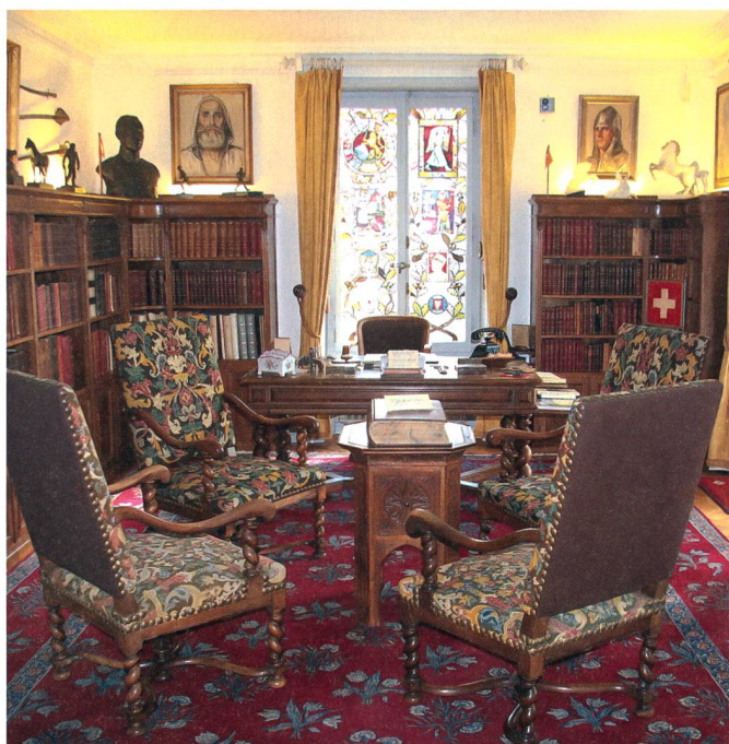
Als ob der General und Hausherr gleich wieder kommt – Guisans Arbeitszimmer in Verte Rive.

Der Besuch in Verte Rive löste in mir aber mehr aus als den «Start» des mittlerweile