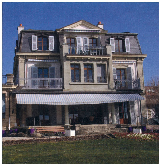
Verte Rive in Pully : Arbeits- und Wohnort von General Henri Guisan.