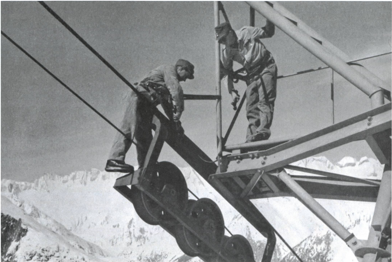
Seilbahnunterhalt, eine anspruchsvolle und gefährliche Tätigkeit.