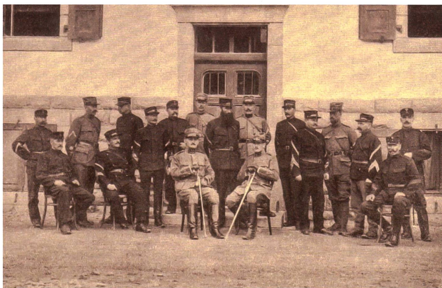
Die Fort Wachen war die Vorgängerorganisation des FWK.

Im ersten «Dienstreglement für das Festungswachtkorps» vom 1. Februar 1942 sind in Art. 1 die Aufgaben des FWK umschrieben: