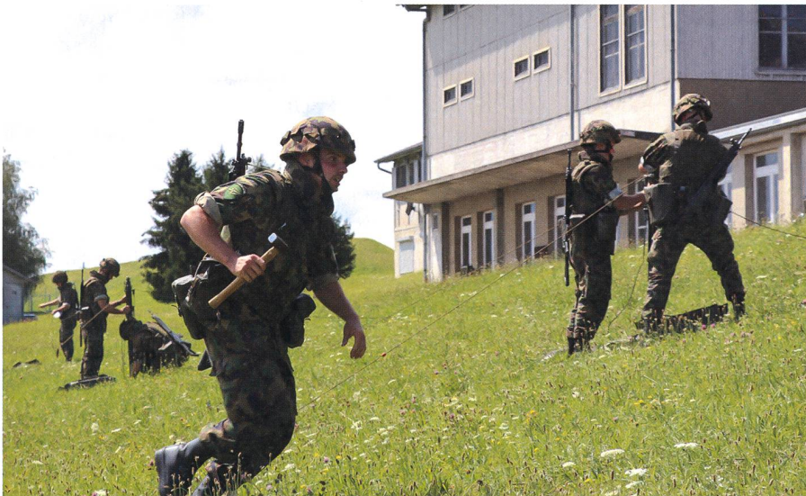
Voller Einsatz: Die Übermittlungssoldaten trainieren den Aufbau einer Antenne.