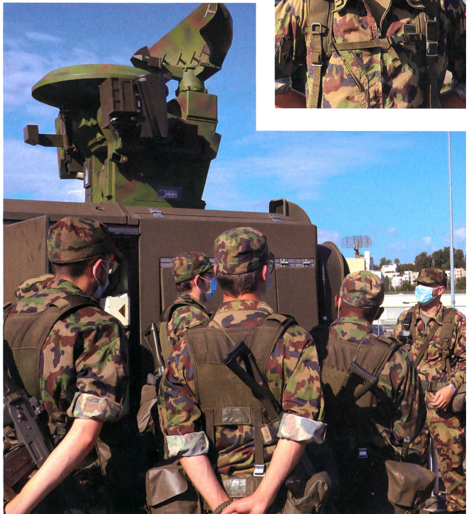
Ausbildung am Radar: Die Handgriffe müssen bald sitzen.