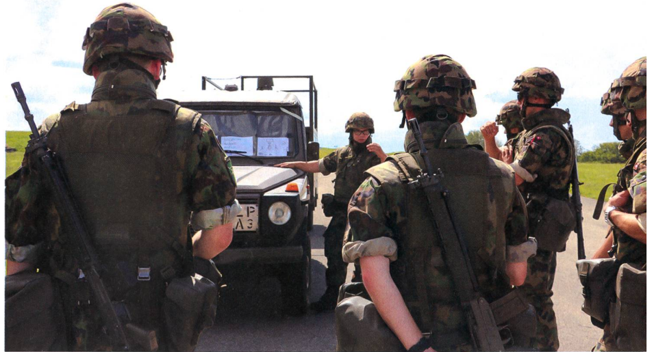
Mitdenken! Ein Gruppenführer bei der Befehlsausgabe. Seine Soldaten müssen auch mental hohe Leistungen erbringen.

Bei der Fliegerabwehr scheint der Grundsatz: Jeder Rekrut, ob angehender