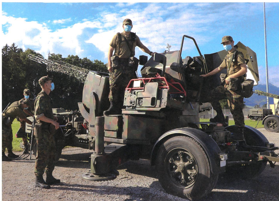
«Und der Himmel brennt»: Fliegerabwehrsoldaten posieren stolz mit ihrem Waffensystem.

Französisch kommuniziert. Aufgrund der Verkleinerung der Armee gibt es nicht mehr für alle Sprachregionen eine eigene Abteilung.