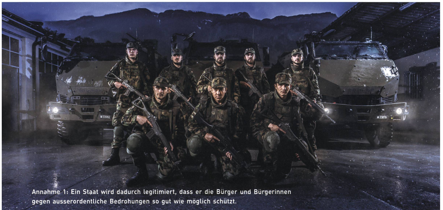
Annahme 1: Ein Staat wird dadurch legitimiert, dass er die Bürger und Bürgerinnen gegen ausserordentliche Bedrohungen so gut wie möglich schützt.

Nun zeigen wir unsere Annahmen auf, folgen drei mögliche Modelle der Zukunft der Schweizer Armee daraus und schliessen schlussendlich damit ab, welches Modell als Einziges alle Annahmen erfüllen kann.