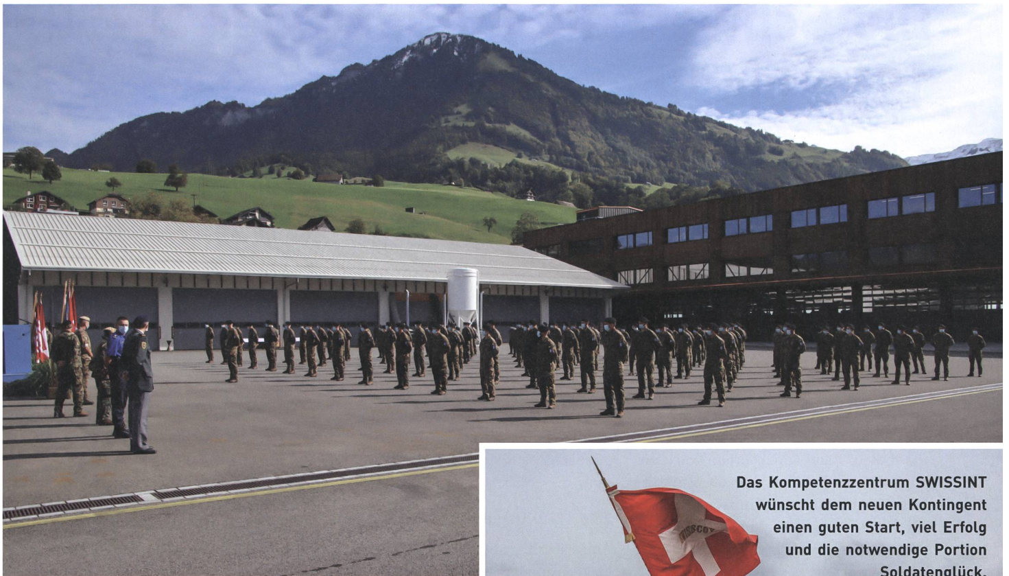
Die Angehörigen des 44. Kontingents wurden aus dem Einsatz entlassen.