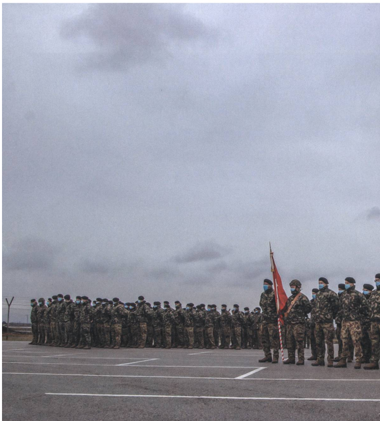
Das 45. Kontingent wird von Oberst i Gst David Regli geführt.

Das Kompetenzzentrum SWISSINT wünscht dem neuen Kontingent einen guten Start, viel Erfolg und die notwendige Portion Soldatenglück.