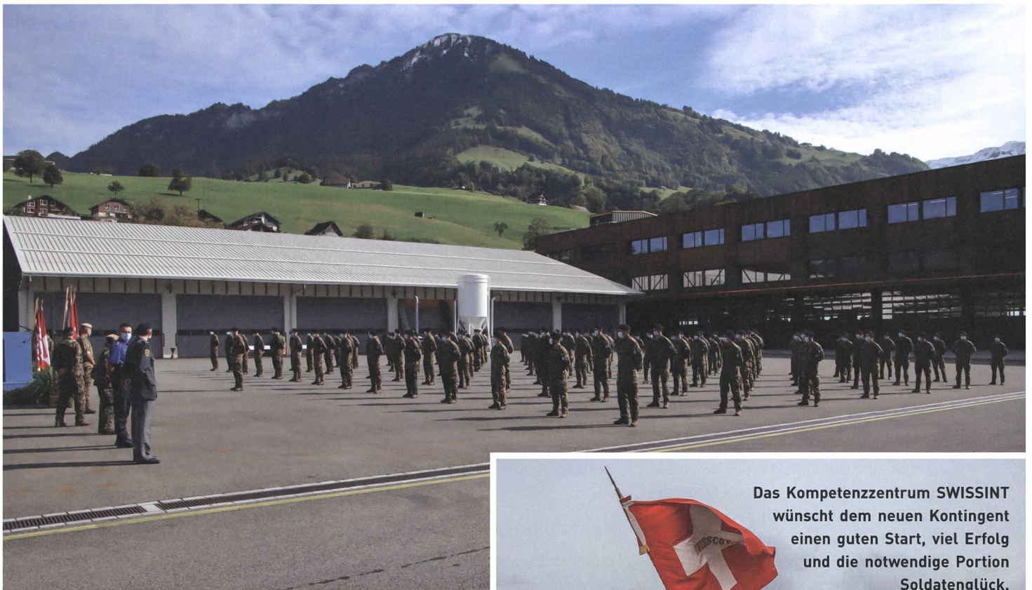
Die Angehörigen des 44. Kontingents wurden aus dem Einsatz entlassen.