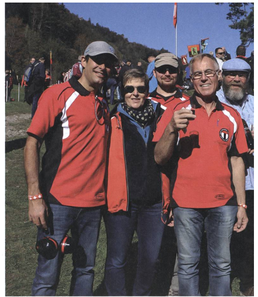
Neben dem Schiessbetrieb kam natürlich auch