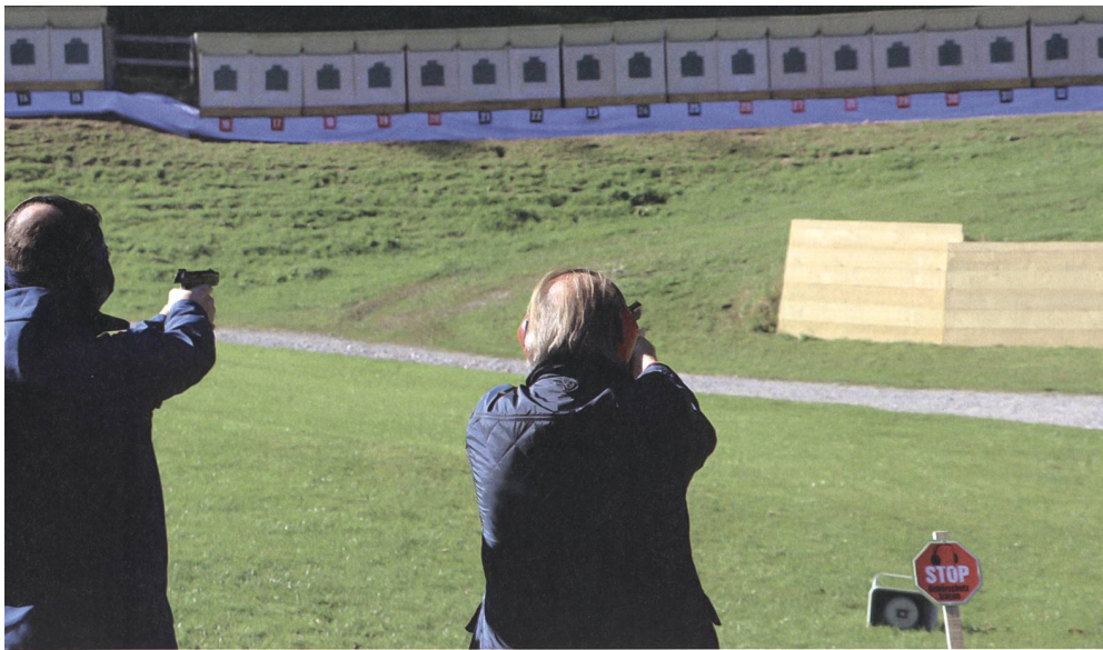
Schützen aus der ganzen Schweiz haben das Schiessprogramm auf 50 Meter absolviert.