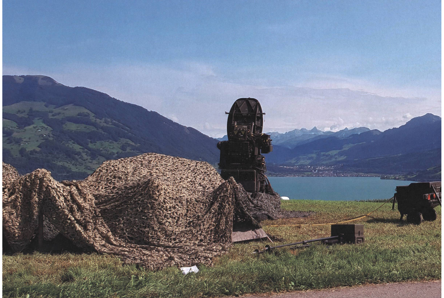
Eine Feereinheit Rapiert in Stellung.