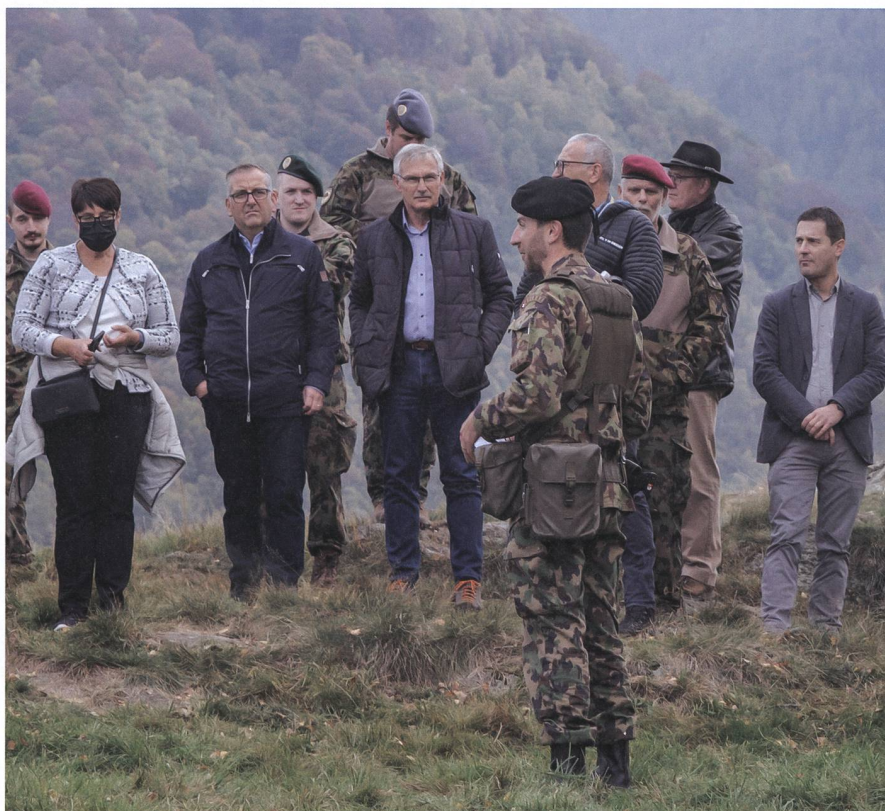
Die Schwyzer Kantonsregierung zu Besuch beim Geb Inf Bat 29.

Der gegenseitige Austausch und die Einblicke in das Ausbildungsprogramm des Bataillons wurden beidseits geschätzt. Sichtlich zufrieden und «bestückt» mit einem kleinen Präsent wurden die Gäste schliesslich in den verdienten Feierabend entlassen. +