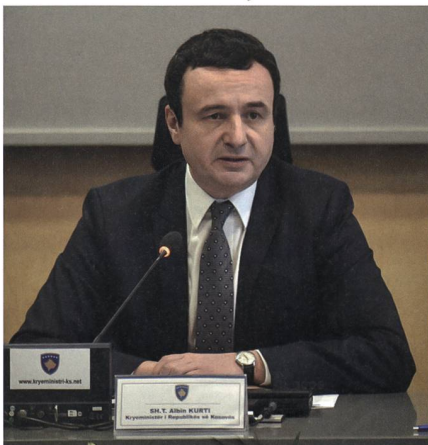
Albin Kurti, Regierungschef der kosovarischen Regierung, will unter Beweis stellen, dass er alles für die Unabhängigkeit des Kosovos tut.

Serbien hat die Unabhängigkeit des Kosovos nie anerkannt und verhindert bis heute, unterstützt vor allem von Russland und China, die kosovarische Mitgliedschaft in diversen internationalen Organisationen.