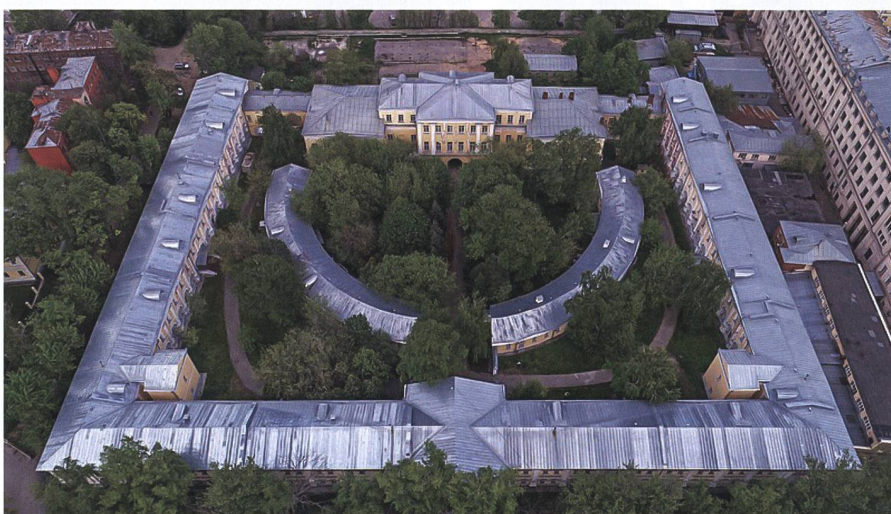
Der Lefortowo-Palast, benannt nach Lefort, ist heute das Russische Staatliche Militärhistorische Archiv.

Der alte Krieger, dessen Loyalität zu Sophia durch Peters Befehl arg strapaziert wurde, hielt Kriegsrat in der Sloboda und entschied sich schliesslich für Peter. Sophia und ihre Anhänger verliessen Moskau Richtung Sibirien. In Russland begann eine neue Ära: Peter Alexeiewitsch wurde zum «Selbstherrscher aller Reussen». ❏