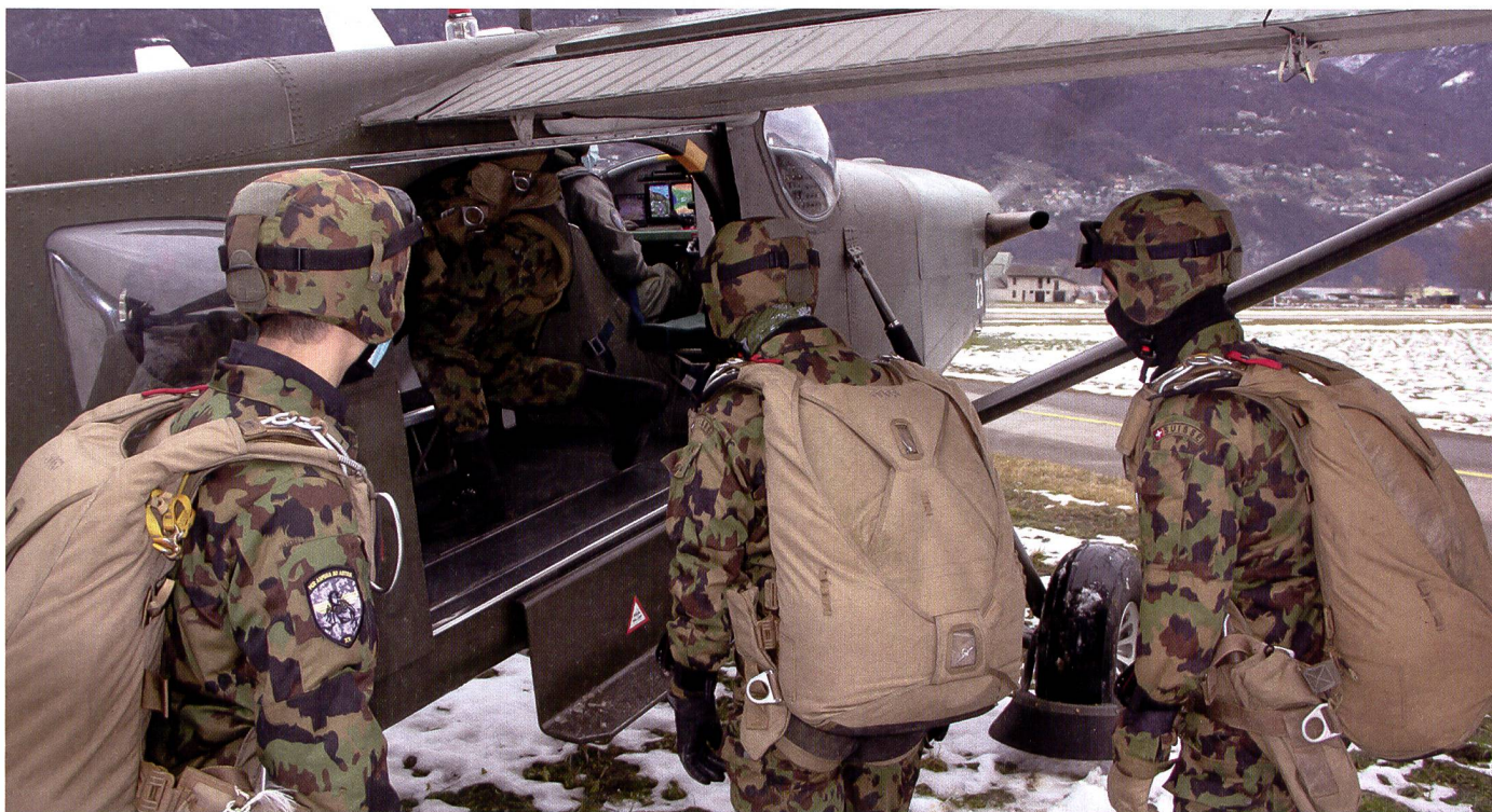
Die Fallschirmaufklärer beschaffen Nachrichten zugunsten des Kommando Spezialkräfte und der operativen Führung der Armee.