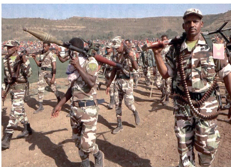
Truppen der TPLF.

sie den Beginn einer Militäroffensive zur Wiedererlangung der Kontrolle über die Region. Dabei werden als erstes die Telekommunikationsverbindungen im Konfliktgebiet unterbrochen und die Stromversorgung eingestellt.