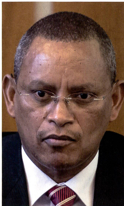
Debretsion Gebremichael: Vorsitzender der TPLF.

Viertens lehnte die TPLF die Verschiebung der Wahlen zur Bildung der ordentlichen Bundesregierung ab. Diese sollten ursprünglich 2020 stattfinden, wurden dann jedoch aufgrund der Covid-19 Pandemie für unbestimmte Zeit verschoben.