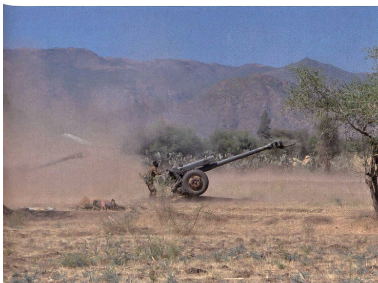
Artilleriestellungen der ENDF.