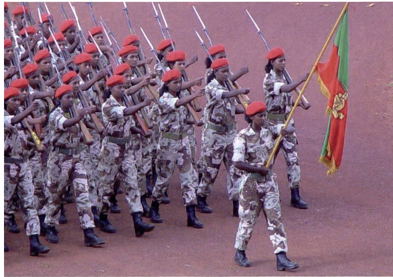
Soldatinnen der Äthiopischen Streitkräfte.