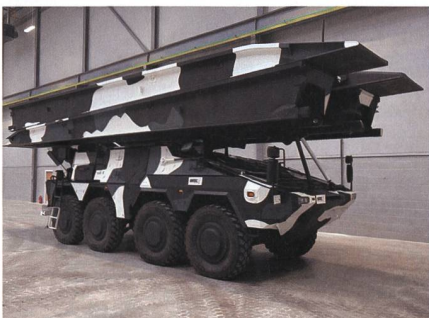
Neue Brückenlegeversion des Boxer.

Auf der Verteidigungsmesse DSEI in London wurde der Radpanzer Boxer mit militärischer Schnellbrücke zum ersten Mal der Öffentlichkeit vorgestellt. Wie der britische Brückenhersteller WFEL mitgeteilt hat, gehört der Brücken-Boxer zu den schnell einsetzbaren Brückensystemen, die WFEL zusammen mit der Muttergesellschaft Krauss-Maffei Wegmann (KMW)