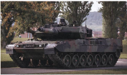
Leopard 2 A7V für die Bundeswehr.

Die Bundeswehr hat die ersten vier modernisierten Kampfpanzer Leopard 2 A7V erhalten. Wie die Panzergrenadierbrigade 37 mitteilte, wird das PzBtl 393 als erster Verband mit diesen Panzern ausgestattet, um damit ein Teil der Very High Readiness Joint Task Force (VJTF), der schnellen Eingreiftruppe der NATO, zu werden.