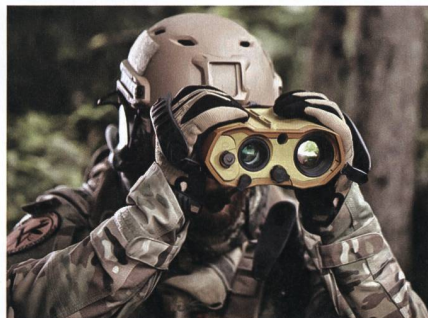
Safran Vectronix MOSKITO TI.

Der europäische Optronik-Spezialist Safran Vectronix AG und der israelische Staatskonzern Rafael Advanced Defense Systems Ltd. kombinieren die Beobachtungs- und Ortungseinheit MOSKITO TI