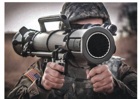
Neuer Verkaufserfolg für Carl-Gustaf M4.

Zu dem Kunden wollte Saab keine Stellung nehmen. Carl-Gustaf M4 ist die neueste Version des schultergestützten Mehrzweckwaffensystems. Es bietet den Anwendern eine breite Palette von Einsatzoptionen und ermöglicht es den Trup-