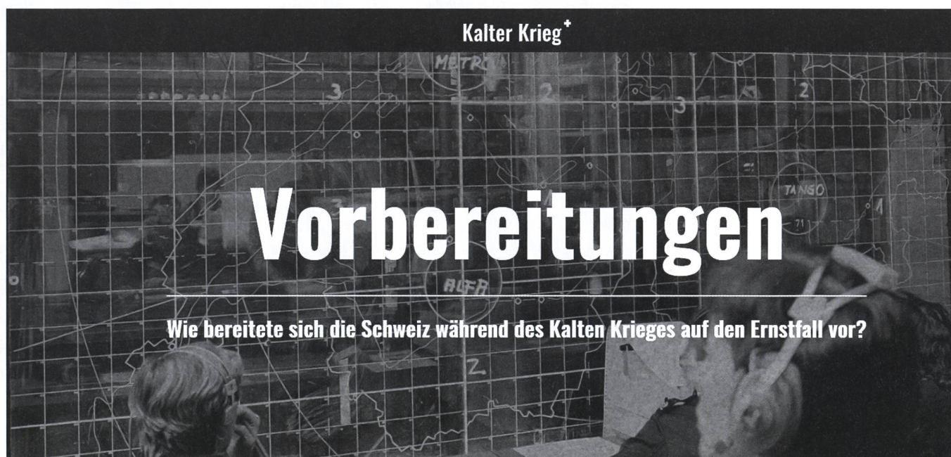
Kalterkrieg.ch: Der Kalte Krieg wird multimedial erklärt.

Die Arbeit am Projekt ist für den Neunzehnjährigen trotz der Abgabe seiner Ma-