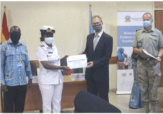
Übergabe der Kursdiplome durch den Schweizer Botschafter Philipp Stadler.