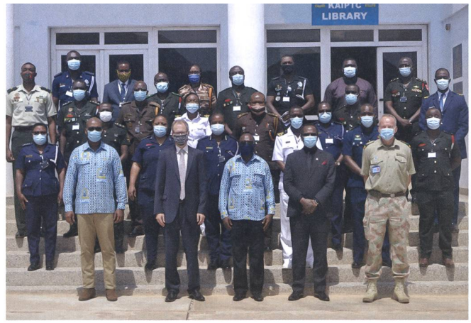
Kursfoto des Protection of Civilian Kurses 2020.

wurde und auch in der neuen Form den Qualitätsstandards der UNO entspricht. Dies benötigt viel Zeit für Recherche und Koordination.» Derzeit muss Lünsmann oft das Beste aus der Lage machen, da COVID auch den Betrieb im KAIPTC erschwert. Durch die Reiseauflagen (geschlossene Grenzen) ist es sehr schwierig geworden internationale Teilnehmer und Ausbilder einzuladen.