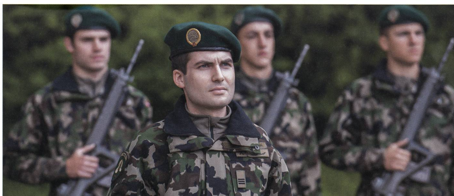
Als besonders grosse Herausforderung dürfte sich in naher Zukunft die notwendige Alimentierung von 100 000 Armeeangehörigen erweisen.