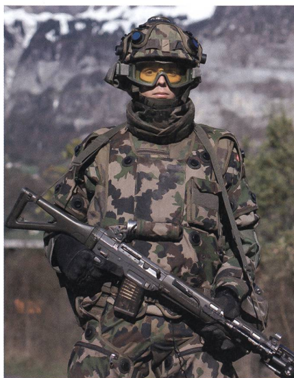
Das Sturmgewehr 90 ersetzt das Sturmgewehr 57. Es wurde als präzise und zuverlässige Waffe bei der Truppe geschätzt.

4. Regionale Verankerung: Zivile Behörden werden rasch und flexibel von Territorialdivisionen unterstützt, sie leisten