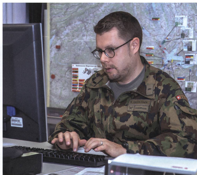
Besonders für Milizoffiziere, die sich bis zum Kompaniekommandanten oder Stabsoffizier ausbilden lassen, zahlen sich die Boni der WEA besonders aus.