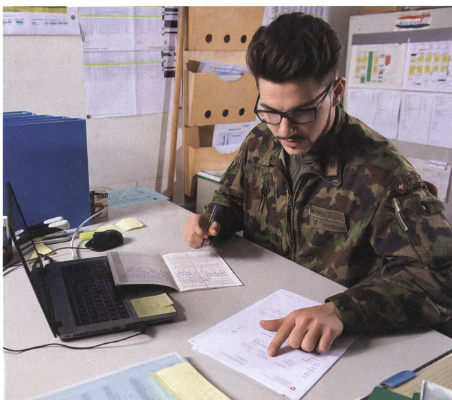
Seit der WEA hat die Kombination einer militärischen Kaderlaufbahn mit einem Studium grosse Vorteile erhalten.

Auf Anfrage bestätigt das Personelle der Armee, dass in jedem Fall die Ausbildungsinstitution in der Schweiz ansässig sein müsse. Das schliesst aber nicht aus, dass man auch eine Ausbildung anrechnen darf, die teilweise oder ganz im Ausland absolviert wird (z.B. Sprachaufenthalte).