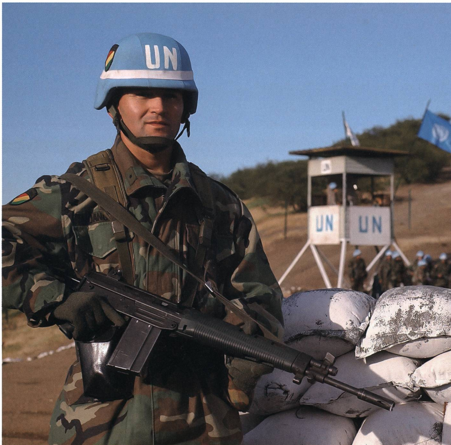
Parallel sinkt die Handlungsfähigkeit der internationalen Sicherheitsorganisationen wie der UNO und der OSZE.

Die USA haben in den letzten Jahren ihre Führungsrolle teilweise aufgegeben. Dies habe dazu geführt, dass vor allem China und Russland versuchten, ihren Einfluss