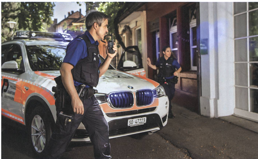
Sicherheitspolitik ist eine Verbundaufgabe von Bund, Kantonen und Gemeinden.