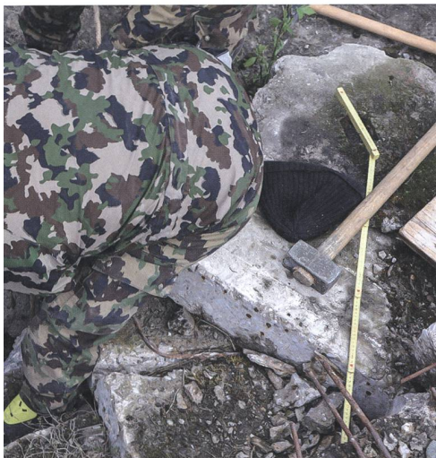
ungssoldat sein will, muss sich auch zu den