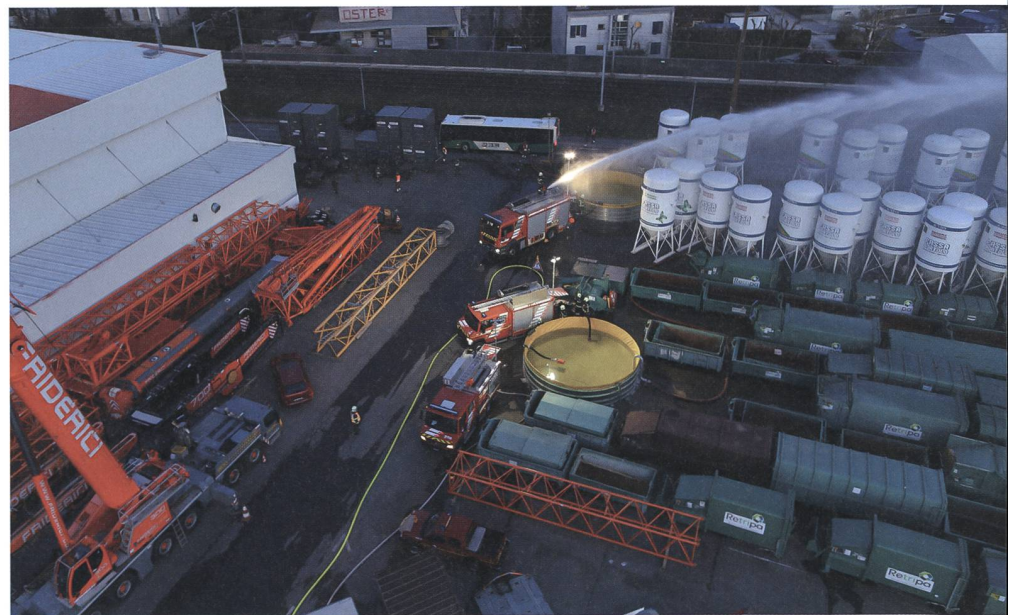
Vogelperspektive: Die zivilen und militärischen Systeme arbeiten zusammen. Die Löschbecken wurden von der Armee aufgestellt und befüllt. Die Feuerwehr Morges nutzt ihre Tanklöschfahrzeuge, um den Brand zu löschen.