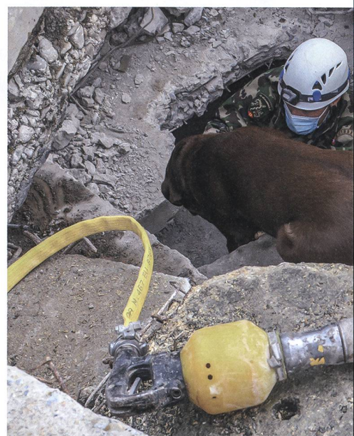
Unterstützung vom Rettungshund: Trotz mode einfach unschlagbar, wenn es um die Ortung vo