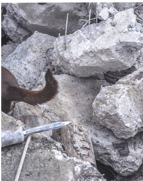
ner Technologie bleibt die Nase des Hundes erschollenen Personen geht.