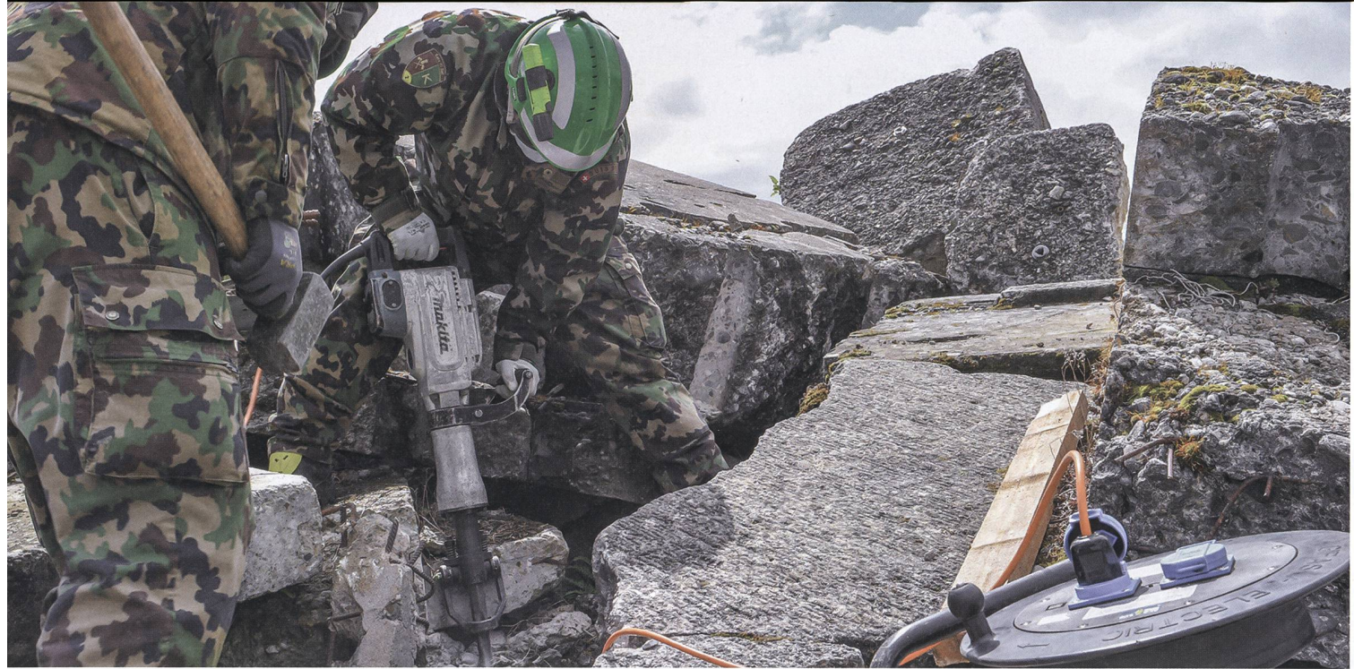
Das Rettungsbataillon kann verschüttete Menschen aus einer Trümmerlage befreien.