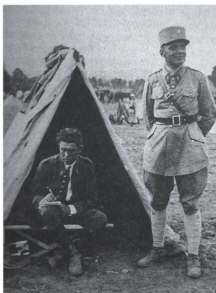
Auch in der Fremdenlegion waren Schreibstift und Notizblock treue Begleiter von Schriftsteller Friedrich Glauser.

seille und Toulon gelegenen Kleinstadt Aubagne ihre jetzige Basis. Längst sind die Zeiten der Kolonialarmee vorbei, und heute leistet die Legion im Rahmen von UNO- und NATO-Mandaten friedenssichernde Einsätze. Terrorbekämpfung und Geiselnbefreiungen, aber auch effiziente Katastrophenhilfe bei Waldbränden, Lawinenunfällen und Überschwemmungen sind weitere Einsatzgebiete der multinationalen Elitetruppe Frankreichs. Für Schweizer ist heute die Legion kaum mehr ein Thema, und deren Anteil ist marginal. +