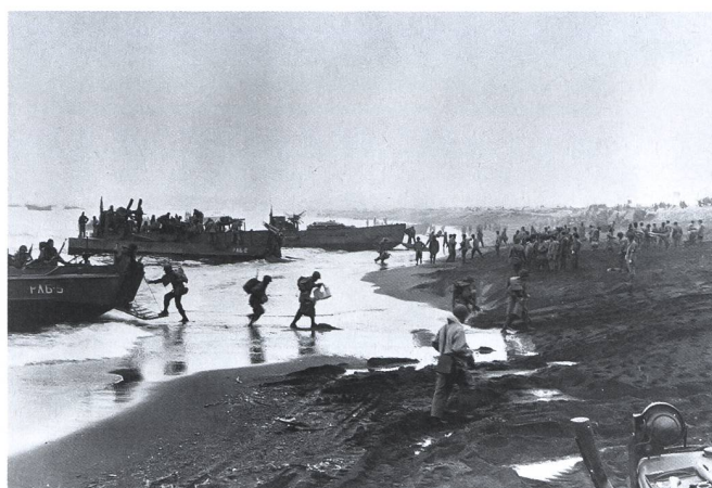
Angelandete US-Soldaten am Strand von Massace Bay auf Attu.