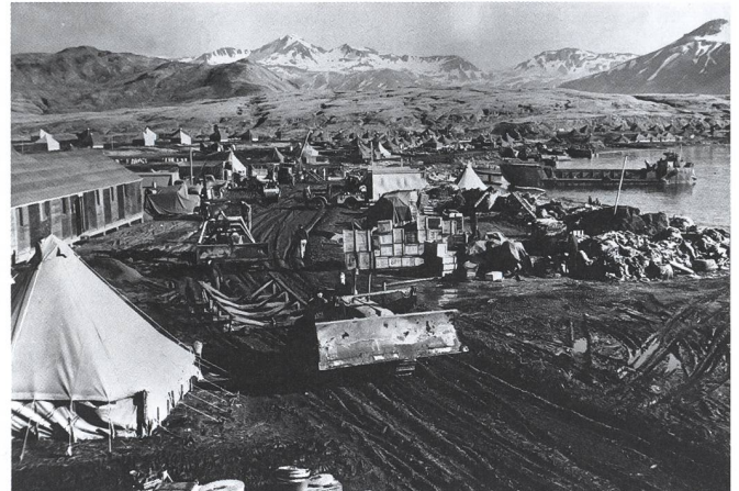
Nach der erfolgreichen Rückeroberung von Attu wird der Brückenkopf für weitere Operationen ausgebaut.