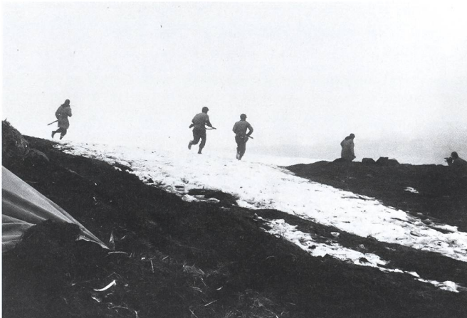
Nach der Landung rücken die US-Soldaten vor. Die Aufnahme vermittelt gut die Wetterbedingungen im Mai 1943 auf Attu.