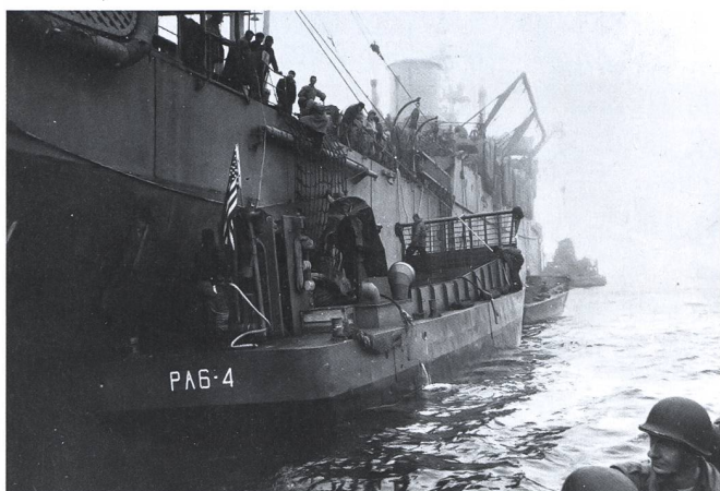
11. Mai 1943. Tag der Landung auf Attu. US-Soldaten steigen von der USS Heywood in Landungsschiffe um, die längsseits angelegt haben.