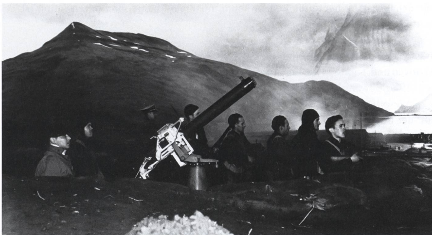
3. Juni 1942, Dutch Harbor, Aleuten. Die Crew einer Maschinengewehrstellung beobachtet die abfliegenden japanischen Kampfflugzeuge. Im Hintergrund der Rauch der von japanischen Sturzkampfbombern in Brand geschossenen SS Northwestern.

Text: Major Kaj-Gunnar Sievert