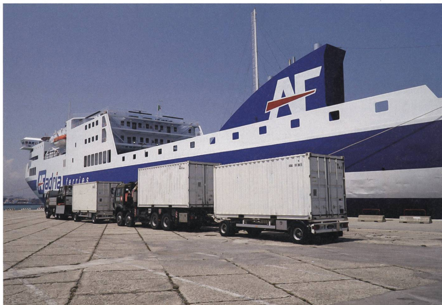
Die Lastwagen der SWISSCOY im Hafen von Ancona, Italien.

Die Reisezeit auf der Fähre dauert 14 Stunden. Viel laufe auf der Fähre allerdings nicht, denn, wie der junge Lastwagenfahrer sagt: «Meistens sind wir alle müde von der Fahrt. Darum gehen wir nach dem Abendessen bald schlafen. So