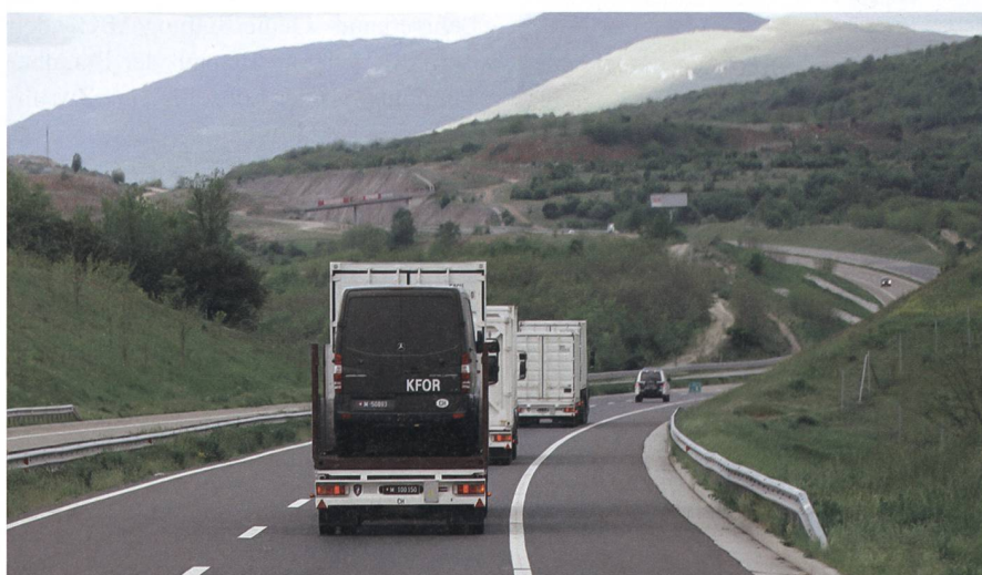
Die Internationale Militärpolizei eskortierte den Konvoi bis an die albanische Grenze, wo die albanische Militärpolizei sie ablöste.

Als militärischer Konvoi werden sie in den meisten der zu durchquerenden Län-