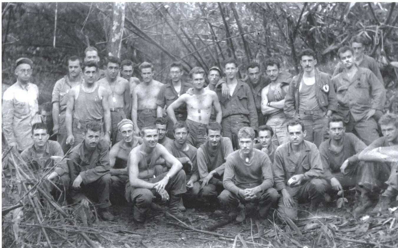
Die Angehörigen der «Merrill's Marauders» waren alles Freiwillige.

verschickte Telegramm begann mit: «Wir bedauern, Sie zu informieren» ... erst dann wurde erklärt, dass wir nicht schreiben könnten.