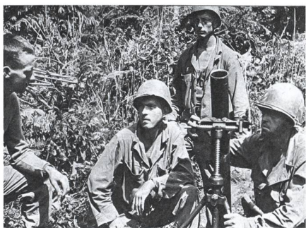
Die 60-mm- und 81-mm-Mörser waren die einzigen «schweren» Unterstützungswaffen.