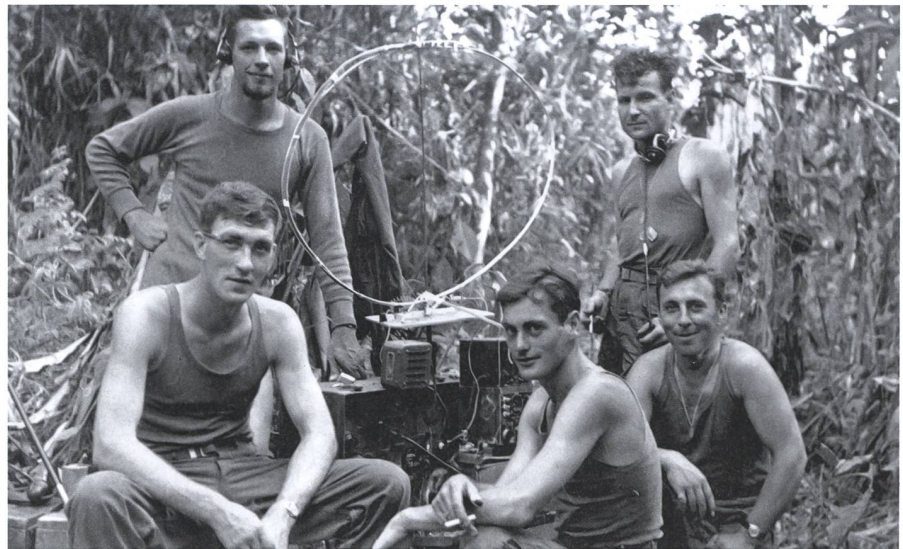
Funkverbindung war eine unabdingbare Voraussetzung, um hinter den feindlichen Linien operieren zu können. In der Regel marschierten die Übermittler den ganzen Tag, um dann während der Nacht die Meldungen zu senden und zu empfangen.

ressant. Die Sanitäter im U.S. Army 20th General Hospital waren extrem besorgt, da der Artillerielärm jeden Tag näher kam und sie Befehle zur Evakuierung erwarteten, die nie kamen.