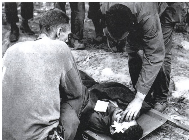
Die in jedem Combat-Team eingeteilten Ärzte waren sehr gefordert.

Nach ein paar Tagen dachte ich, es ginge mir besser. Das mag für Sie nicht realistisch erscheinen, aber Sie müssen verstehen, dass man sich zu keiner Zeit normal fühlte. Wir litten immer an Fieber, irgendeiner Form von Ruhr, waren erschöpft oder hatte Hunger. Wenn Ihre Drüsen unter dem Kinn oder den Armen nicht geschwollen waren, waren Sie nicht krank. Egal wie Sie sich fühlten. Die allgemeine Regel war, dass nur wer drei Tage lang 39,4 Grad Fieber hatte, wahrscheinlich evakuiert werden würde. Das ist nicht richtig, aber mit einer noch geringeren Anforderung wäre jeder evakuiert worden. Einige Zeit nachdem wir den Flugplatz in