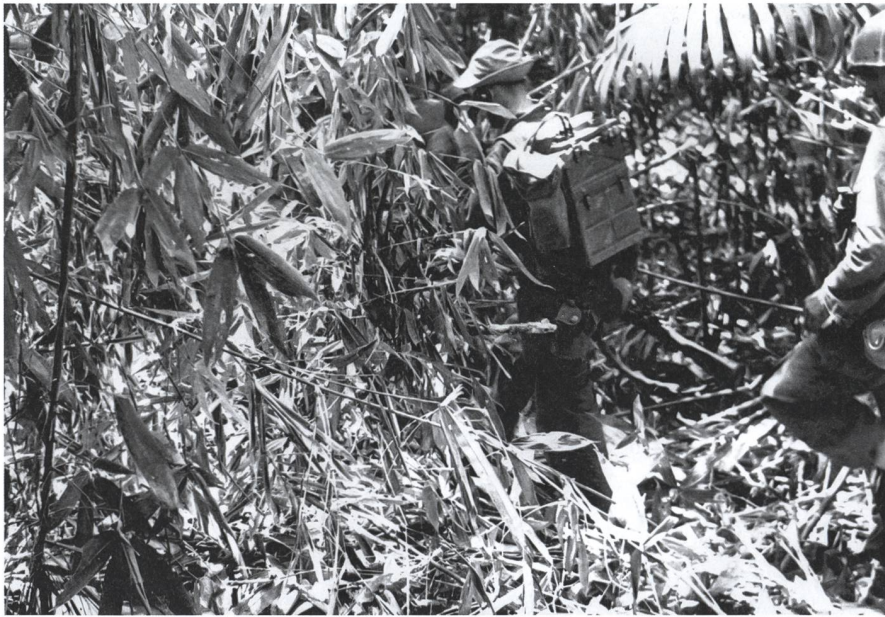
Eine Patrouille unterwegs im Dschungel vom Burma.