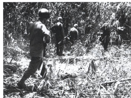
Um beweglich und lautlos zu sein, trugen die Männer während einer Patrouille nur leichtes Gepäck.

Passanisi: Wie gesagt, das 1. Bataillon marschierte 24 Stunden lang – abgesehen von jeweils zehn Minuten Pausen pro Stunde – ohne Unterbrechung.