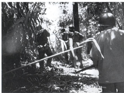
Der Kampf im Dschungel wurde teilweise auf sehr kurze Distanzen ausgetragen.