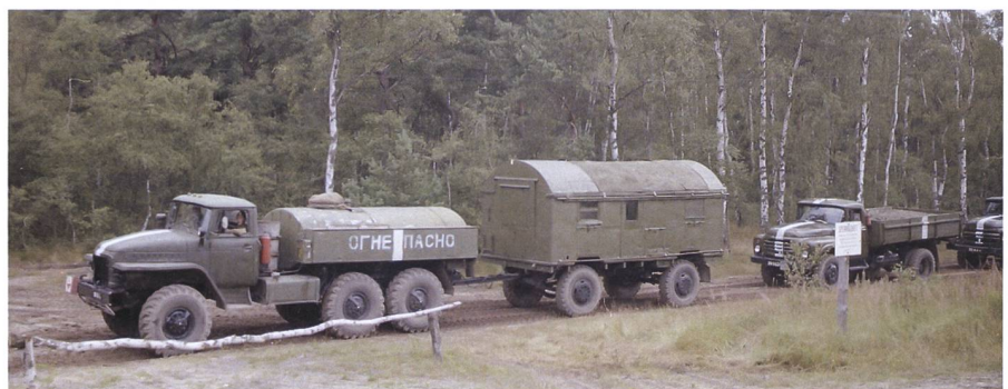
Sorgen bereiteten den Westmächten die viele hundert Kilometer langen, panzergängigen Behelfswege entlang den wichtigsten Hauptstrassen durch die riesigen Waldflächen der DDR. Damit waren unter dem Schutz der Baumkronen gedeckte Verschiebungen und damit schwer erkennbare Aufmärsche möglich.

Für die westlichen Missionen waren die Kontakte zur Bevölkerung in der DDR etwas ganz Besonderes. Immer wieder und spontan konnten sie solche Treffen mit den Einheimischen erleben und stiessen dort auf erstaunlich viel Goodwill. Die Fahrzeuge mit den Nummernschildern westlicher Missionen waren gleichsam die Anziehungspunkte. +