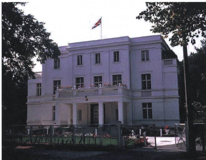
Das Hauptquartier der Britischen Militärmission (BRIXMIS) in Potsdam.

Die US-Militärmission, als Beispiel, verfügte über zehn Fahrzeuge und glieder-