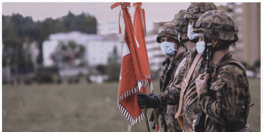
Die Mobile Fliegerabwehrlenk Waffen-Abteilung 411 tritt den Dienst mit 600 Mann aus den zwei fusionierten Abteilungen 4 und 11 an.