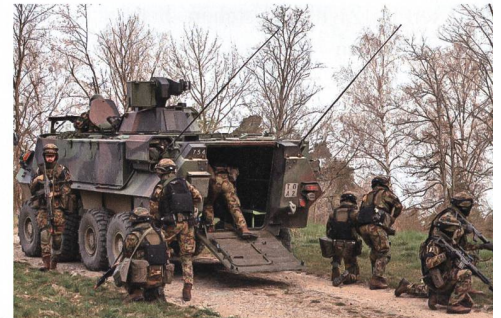
Militärische Fachkompetenz: Verbands-training.

Militärisches Wissen, Didaktik und Pädagogik, Führung, Sprachen, Sport und Informationstechnologie bilden die Hauptelemente des Lehrplans, welcher mehr als 20 externe Kurse umfasst. Die Teilnehmenden absolvieren die Module, die zum Eidgenössischen Fachausweis Ausbilder/in führen und legen das Leadership Zertifikat der SVF ab, zwei national anerkannte Zertifizierungen. Während des UNTAC-Kurses in Schweden, der leider 2020 und 2021 der COVID-Pandemie