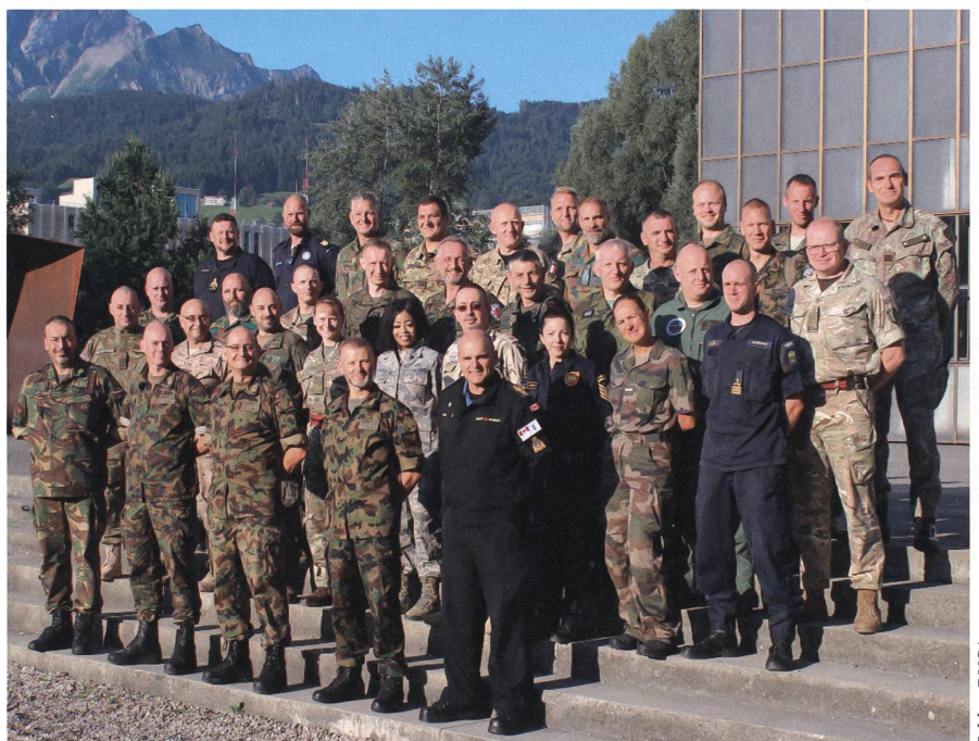
Internationaler Benchmark: NCO Leadership Courses.