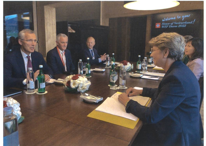
«Wir dürfen dabei keine Verpflichtungen zur gemeinsamen Verteidigung eingehen, oder Abhängigkeiten schaffen, die in der Praxis dasselbe bedeuten. Aber Vorbereitungen treffen für den Fall, dass man auch in der Verteidigung zusammenarbeiten müsste, das kann man als neutraler Staat.»

gehört nicht zum Verantwortungsbereich meines Departementes.