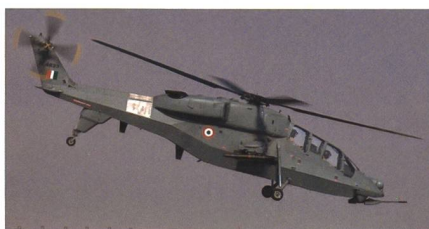
Leichter Kampfhelikopter (LCH).

Die Indian Air Force hat den einheimischen leichten Kampfhelikopter 'Pra-