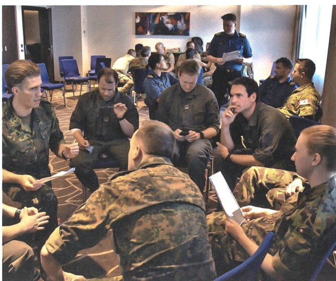
Offiziere aus elf Nationen werden sich am Samstag, 8. Oktober, in Stans einfinden.