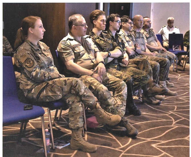
Die Organisatoren wollen dazu beitragen, dass die stark verkleinerten Streitkräfte nicht den Kontakt mit der Gesellschaft verlieren.