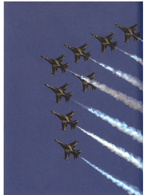
Die Kunstflugstaffel Black Eagles aus Südkorea wurde dafür mit der Trophy für die beste Vorführung ausgezeichnet.