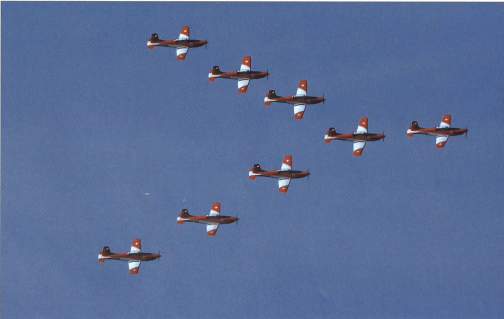
Das PC-7 Team begeisterte das Publikum in Fairford mit präzisen und schönen Displays.