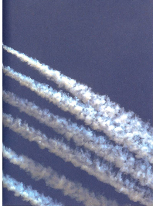
zeigte ein eindrückliches Flugprogramm und führung ausgezeichnet.