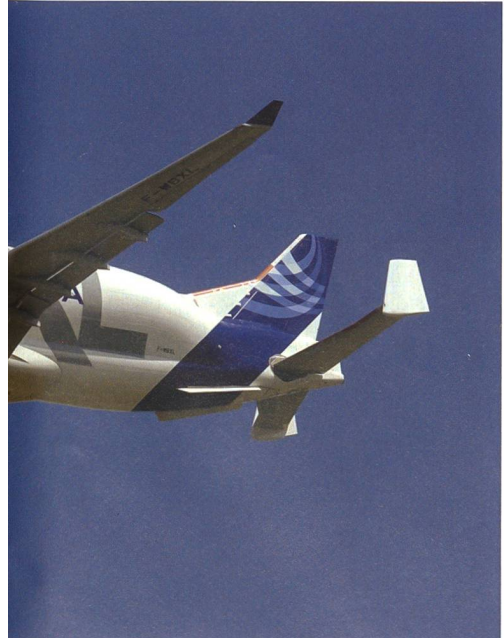
ird für den Transport von grossen Flugzeug-