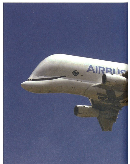
Die Beluga von Airbus, das spezielle Flugzeugbauteilen eingesetzt.