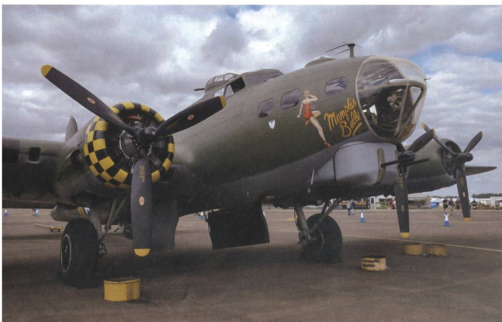
Auch schöne Oldtimer wie hier die B-17 G Flying Fortress durften nicht fehlen.