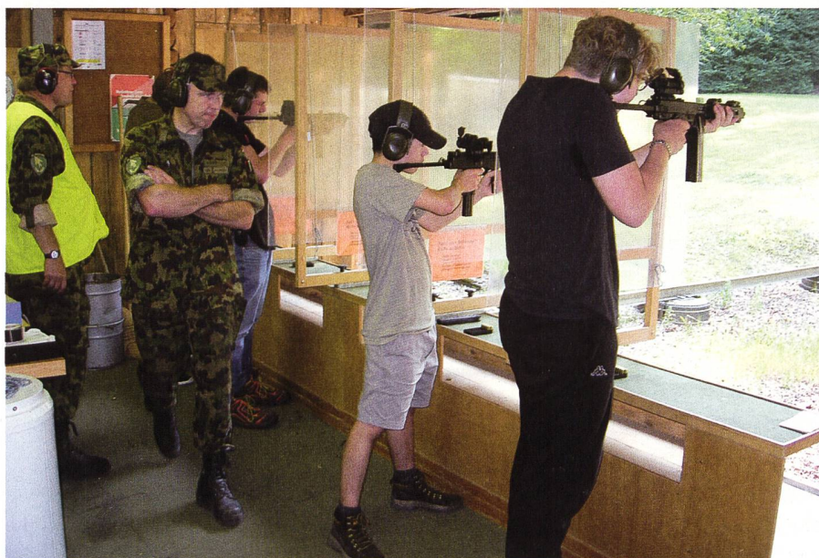
Konzentriertes Schiessen unter kundiger Aufsicht.

Besonders erwähnenswert ist der Schweizerische Militär-Sanitäts-Verband (SMSV). Der SMSV ist der Dachverband von rund