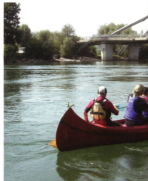
Im Takt zu paddeln, ist gar nicht so einfach,