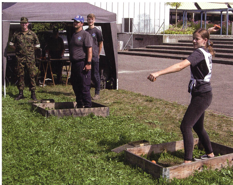
Posten HG-Wurf: Das gibt einen Treffer!