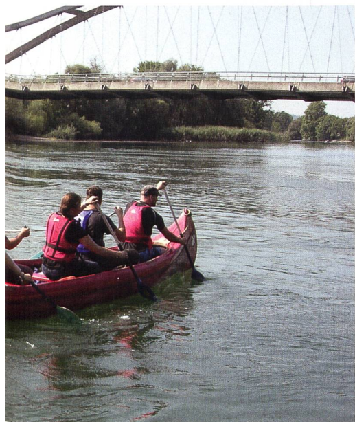
macht jedoch Spass!