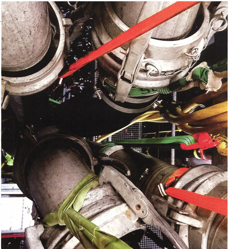
Die Pumpen hatten wir an einem Nachmittag installiert. Anschliessend gab es während ein paar Tagen noch einige Korrekturen zu erledigen. Danach stand immer ein kleines Team einsatzbereit. Die Tage und Wochen, die uns für diese Betreuung zur Verfügung standen, machten den Grossteil dieses Einsatzes aus.

Vor dem Militär hätte ich wohl kaum bei den Bühnenaufbauarbeiten eines Festivals mitgeholfen. Technische und körper-